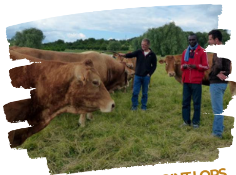
LE CHEF DE PROJET ADJOINT LORS DE SA MISSION EN ALSACE

Depuis 2013, le Ministère de l'Agriculture, de l'Élevage et de la Pêche, met à disposition d'OSCAGRI-Pool un ingénieur de développement rural affecté au projet, qui assure la fonction de Chef de projet adjoint (CPA). Il devra prendre la tête de la future structure agricole du CDP en charge de la coordination des activités de terrain . Le CPA, qui a effectué une mission d'apprentissage et d'échange en Alsace, a ensuite été formé en continu tout au long des différents projets, via une responsabilisation dans les différentes activités : mise en œuvre, suivi, évaluation, coordination. Il tire de son travail de terrain des pistes de réflexion et d'action permettant d'alimenter la stratégie agricole du CDP.