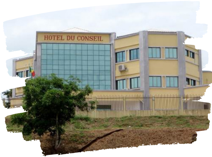
LE CONSEIL DÉPARTEMENTAL DU POOL

Le Conseil départemental du Pool (CDP) est une collectivité relativement jeune, issue du processus de décentralisation engagé au Congo à partir de 2003. La coopération décentralisée entre Ribeaupillé et le CDP animée par Gescod a, comme l'un de ses objectifs, l'appui à la structuration de cette nouvelle entité, autour de priorités de développement identifiées sur le territoire. L'objectif des différents projets menés est de renforcer, à travers le soutien à la relance agricole, la maîtrise d'ouvrage de la collectivité et son rôle de coordination des politiques de développement sur le territoire. Cela passe notamment par l'élaboration d'une stratégie de développement agricole concertée pour le Pool et la mise en place de politiques publiques en appui à l'agriculture.