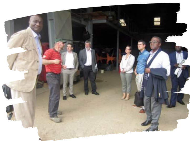
DÉLÉGATION DU CDP EN ALSACE

Enfin, les missions d'échanges organisées dans le cadre du projet permettent de générer des analyses et des orientations sur des axes thématiques spécifiques. Citons en particulier la mission en Alsace du Président du CDP, de son conseiller économique et du Secrétaire Général du CDP, qui leur a permis d'appréhender le modèle français sur la question de la structuration du monde agricole et du rôle des collectivités dans le développement rural. A l'issue de cette mission, le CDP a fait savoir sa volonté de mettre en place en son sein une structure chargée de coordonner les activités de terrain en lien avec le secteur agricole découlant de son plan stratégique.