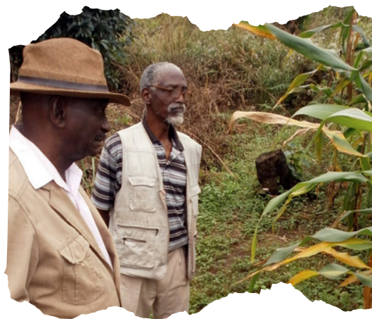
VISITE DU PRÉSIDENT DU CDP DE LA PARCELLE DE PRODUCTION DE SEMENCE À KIAZI

Le renouvellement de l'équipe élue a également eu des implications dans la maîtrise d'ouvrage de l'action par le CDP. Cette situation a généré une rupture temporaire quant au pilotage stratégique et au suivi quotidien du projet. Le travail de sensibilisation effectué a là aussi permis de surmonter ces difficultés et de remobiliser le partenaire. Alors que le Vice-Président du CDP assume le rôle de référent dans le cadre du partenariat, un référent technique a été désigné au sein du cabinet du Président (le Conseiller économique et financier). Il assure depuis lors un rôle de suivi des activités quotidiennes, participe à de nombreuses rencontres ou représente le CDP à l'occasion d'événements organisés dans le cadre de OSCAgri. Le Président de l'institution, quant à lui, préside systématiquement les comités de pilotage. Ces évolutions favorables ont conduit à programmer différentes missions politiques mais aussi techniques en Alsace et au Congo.