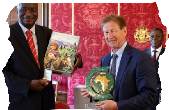
ECHANGE DE PRÉSENTS LORS DE LA VISITE OFFICIELLE DU PRÉSIDENT DU CDP À L'HÔTEL DE VILLE DE RIBEAUVILLÉ

Depuis les échanges menés lors de la mission institutionnelle du Conseil départemental du Pool en Alsace, les engagements réciproques des acteurs institutionnels du partenariat ont été réaffirmés et consolidés, ce qui constitue un élément crucial pour la poursuite de la dynamique d'appui au CDP. Les partenaires ont émis le souhait de renforcer des échanges directs entre élus , ce qui contribuera à soutenir le renforcement des capacités de la collectivité du Pool. L'annonce par les autorités congolaises d'une prochaine réforme de la décentralisation , qui visera notamment à accroître les compétences confiées aux collectivités ainsi que leurs ressources propres, et qui inclut la mise en place d'une fonction publique territoriale, ouvre des perspectives intéressantes pour la poursuite des échanges et l'identification de nouveaux axes de travail pour les partenaires (fiscalité locale, organisation de la collectivité...).