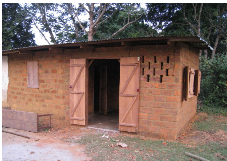
Abris destiné au stockage de produit fini (ferme pilote de Kindamba)

Le projet OSCAgri s'est engagé à fournir aux unités de production d'aliment de bétail des outils de transformation mais également les moyens d'abriter la production. Pour cela, le projet a procédé à l'achat de matériaux de construction et les a remis aux fermes pilotes concernées, qui au travers d'une convention de partenariat ont la charge de construire les bâtiments.