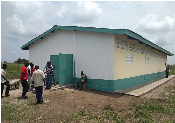
Fin de chantier à Yono, district de Ngabé

Le 24 février et 28 mars, des visites de chantier ont été effectuées par l'équipe projet, le maître d'œuvre et les entrepreneurs concernés à Yono (district de Ngabé) et à Nzinzi (Mindouli). Il a été procédé en deux temps aux réceptions des travaux des bâtiments des coopératives. Sur un même modèle de 20m x 10m et pouvant accueillir un véhicule léger, ces ouvrages permettront