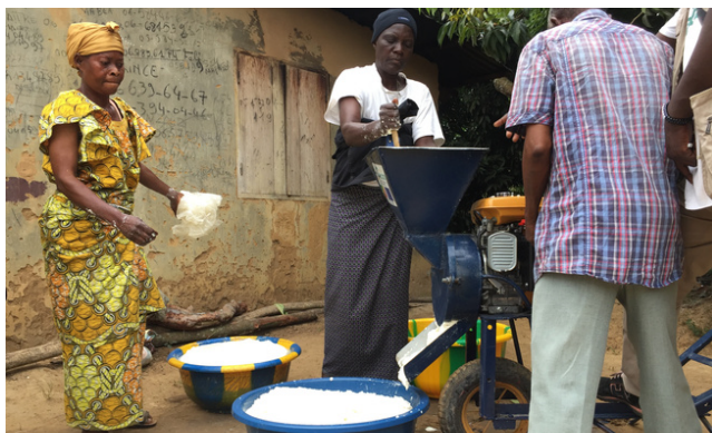
Retour sur l'expérience de la pétrisseuse à manioc

Entre 2021 et 2022, deux nouvelles fermes ont intégré l'Association des Fermes Pilotes du Pool (AFPP), qui apportent leur expertise et leurs compétences aux agriculteurs et éleveurs du Pool, tout en bénéficiant d'un appui du projet sur le renforcement de leurs compétences. Pour les encourager, deux broyeurs destinés à faciliter la fabrication de l'alimentation animale ont été produits localement et distribués à ces nouvelles fermes. Grâce à ce nouveau matériel, les fermes pourront à la fois fabriquer l'alimentation nécessaire à leur élevage et satisfaire la demande d'autres éleveurs au sein de leurs districts respectifs.