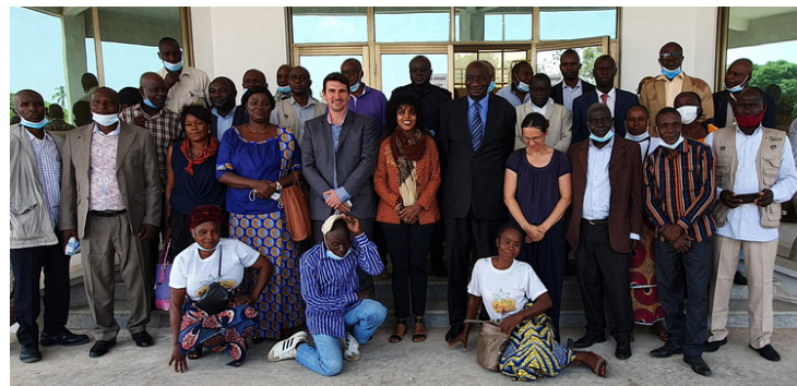
Les participants au séminaire de clôture

Les capitalisations réalisées pour la diffusion des bonnes pratiques ont été exposées, avec notamment les vidéos présentant la place des femmes au sein des organisations paysannes et l'action de restructuration du réseau de l'Union départementale.