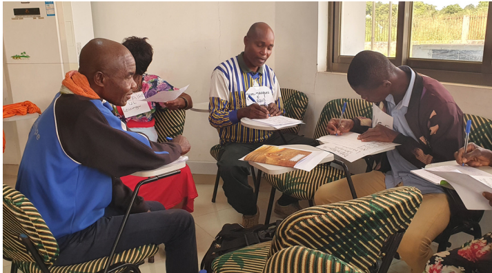
Exercice en groupe : mener une démarche de plaidoyer envers les autorités.

En mai dernier, le réseau de l'Union Départementale des Organisations Paysannes du Pool ( UDOPP ) à bénéficié de 3 jours de formation pour s'initier aux principes de base du plaidoyer. Étant donnée la vocation de représentation et de défense des paysans de cette organisation, une formation au plaidoyer selon un schéma progressif a été élaborée, permettant aux acteurs d'allier des temps de théorie et des temps de pratique à travers des jeux et des exercices. Dans les prochains mois plusieurs ateliers rassembleront l'UDOPP avec les autorités locales et les services déconcentrés de l'État permettront aux agriculteurs de sensibiliser et défendre leurs intérêts auprès des autorités locales.