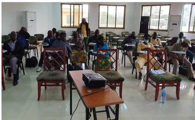
Atelier de présentation du futur projet avec l'UDOPP

Durant quatre mois, 10 groupements féminins se sont familiarisés avec la pétrisseuse à manioc ; une machine réduisant la pénibilité de la fabrication du pain de manioc " chikwangué ". Elle donne également la possibilité aux femmes d'augmenter leur production et donc leurs revenus. Au total, ces femmes ont déjà pétri 7580 kg de manioc avec seulement 60l de carburant . La rapidité et la facilité d'utilisation de la machine sont très appréciées, puisqu'une heure suffit à pétrir dix fois la quantité d'un pétrissage manuel d'une journée. Une mise à niveau des groupements reste toutefois nécessaire pour améliorer davantage leur efficacité, en les formant sur le processus de trempage du manioc (pré-pétrissage). Un processus qui influe grandement sur l'efficacité de la machine.