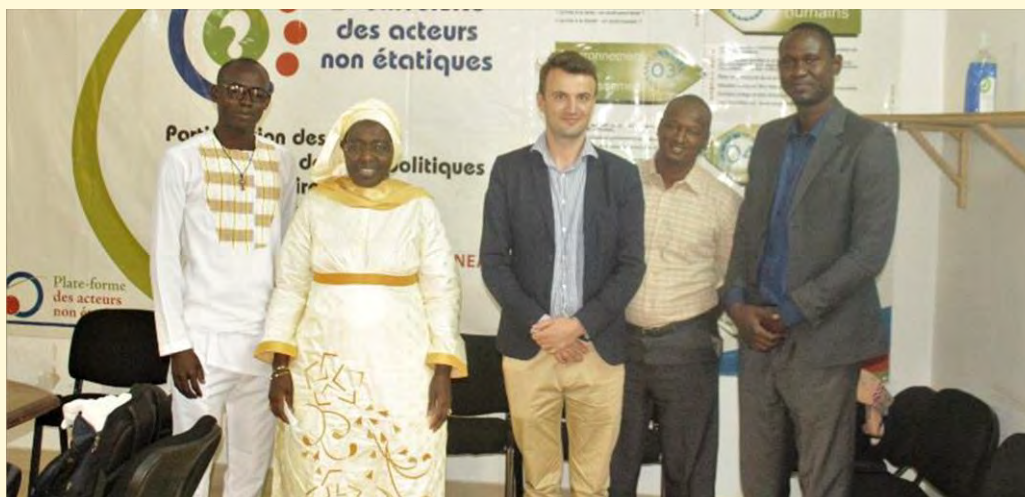
Des participants à la restitution finale à Dakar au Sénégal

Cet accompagnement a été très instructif, et bénéfique. Le jeudi permettait de faire un rappel de la formation avec des partenaires. Même s'ils y avaient des niveaux différents, les échanges ont été fructueux. Les exercices permettaient de mieux comprendre la théorie.