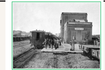
PALESTINE 1880-1900 Visages et lieux de la Palestine Ottomane Un voyage en noir et blanc pour découvrir une Palestine ancienne et vivante, ouverte sur le monde et les autres juifs, chrétiens, musulmans. Drezes et voyageurs vivaient en paix.

Dix-huit panneaux en noir et blanc réalisés à partir de photographies d'époque. Un voyage dans une Palestine oubliée, tout un peuple, son économie, ses traditions mais aussi son ouverture au monde. Une Palestine loin d'être vide et synonyme de poésie.