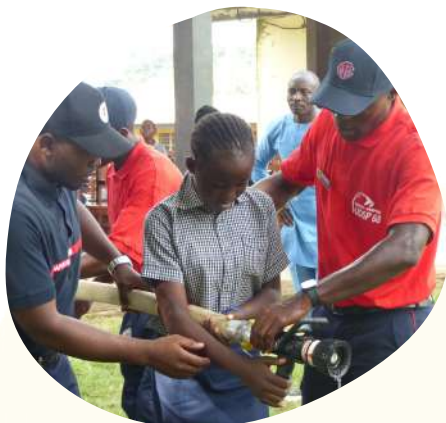
Présentation de l'usage d'une lance à une élève de l'école de la Sonara