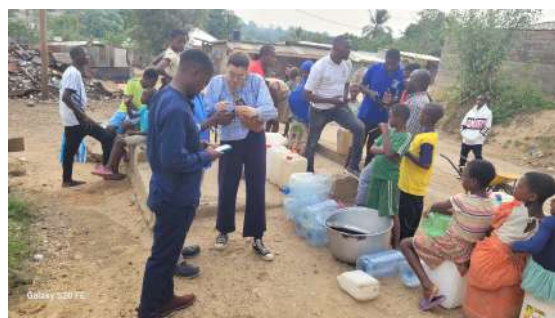
Localisation d'un point d'eau sur mWater