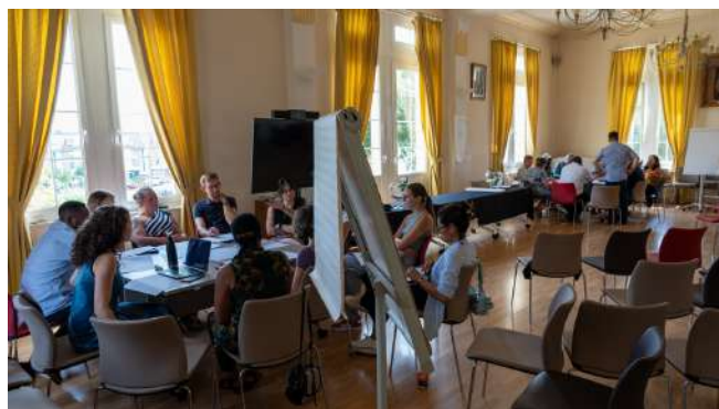
Ateliers réflexifs entre groupes de pairs

Retour en images sur la mission réalisée par la délégation de Loos-en-Gohelle au Cameroun en novembre 2024