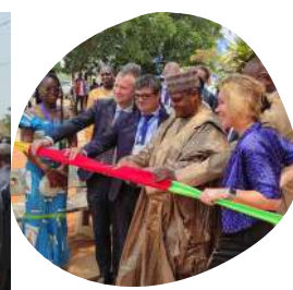
Inauguration de la "Case de l'entrepreneur"