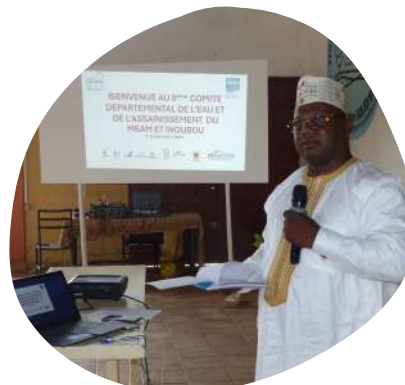
Témoignage du représentant du Syndicat des communes de la Mvila.