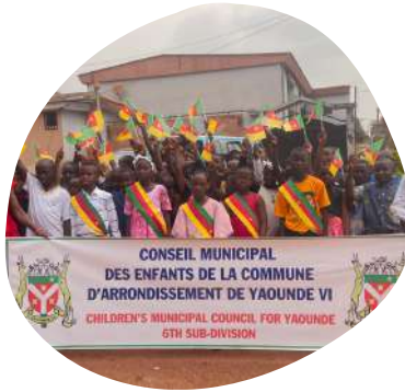
Participation des membres du CME au défilé du 11 février 2025