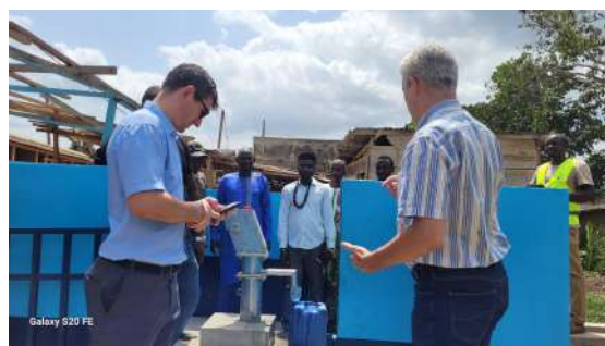
Visite d'un point d'eau réhabilité et échanges avec les bénéficiaires