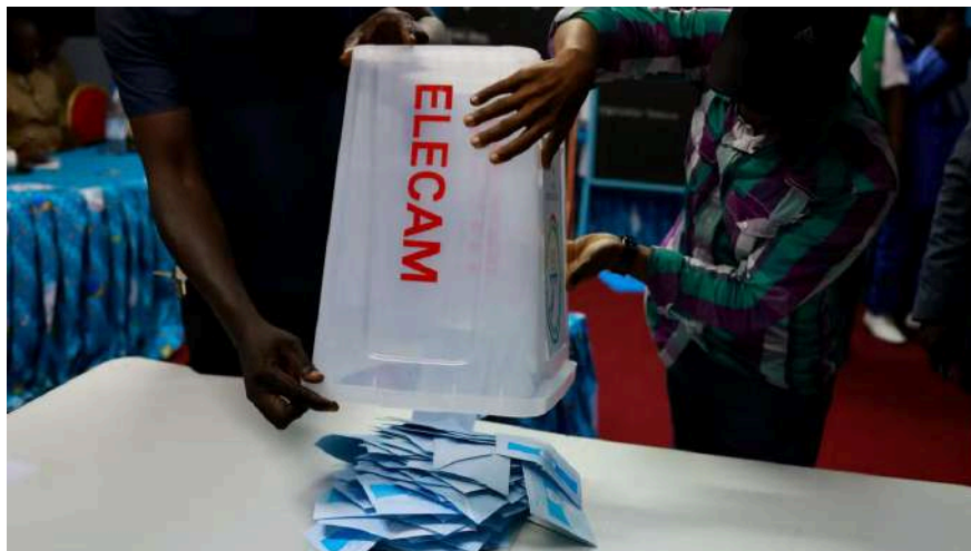
Des agents électoraux vident une urne dans un bureau de vote de la ville de Yaoundé, le 12 octobre 2025, lors de l'élection présidentielle.