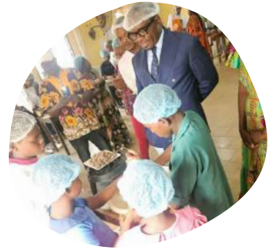
Atelier de cuisine en présence du Maire Yoki Onana

Retour en images sur les échanges Erstein et Yaoundé VI