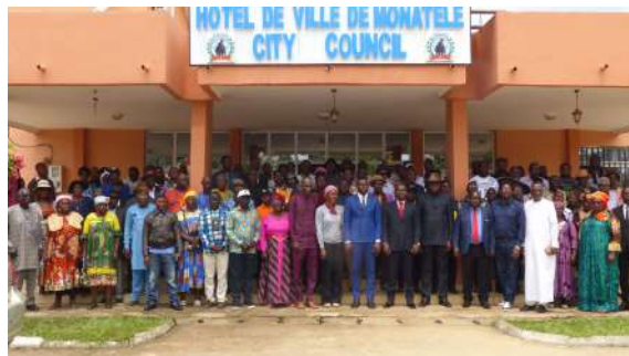
Participants au CDEA Syncolek à Monatéle

Actes 2ème Comité départemental de l'eau et de l'assainissement de la Lékié.