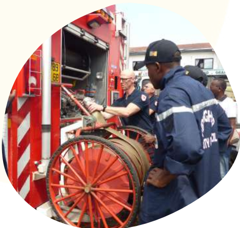
Formation des agents municipaux à l'usage et à l'entretien du fourgon pompe tonne incendie