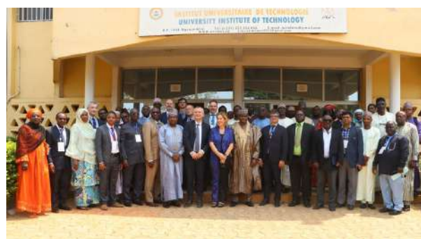
Participants à la mission PACTE à l'IUT de Ngaoundéré