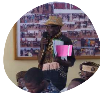
Témoignage d'un chef traditionnel du département