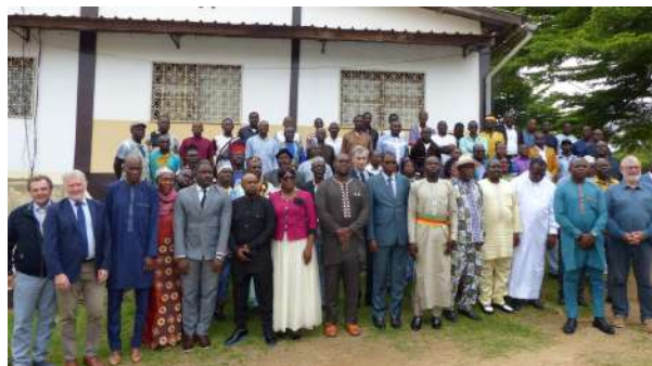
Participants au CDEA Sycomi à Bafia