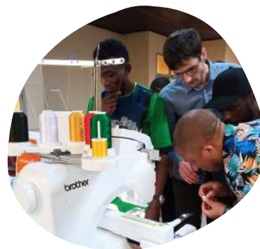
Formation FabLab à l'IUT de Douala