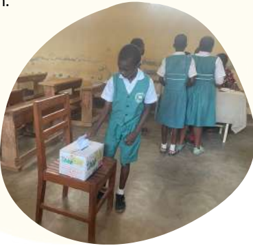
Election du Maire-Enfant et de ses adjoints

En lien avec leurs homologues du Conseil municipal des enfants de la Ville d'Erstein , plusieurs échanges ont permis de réaliser quelques activités de la "feuille de route" établie d'un commun accord avec l'aide de leurs superviseurs conseillers municipaux seniors, agents communaux et enseignants. Les deux groupes d'enfants ont travaillé à la confection de livrets de recettes proposant des plats typiques des deux cultures, qu'ils ont ensuite goûté à l'occasion d'ateliers de cuisine. De la même façon, une capsule vidéos a été échangée favorisant la découverte interculturelle sur la fête de la Jeunesse à Yaoundé et un travail similaire est en cours pour la fête de Noël à Erstein.