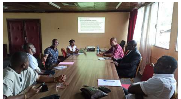
Réunion bilan entre les consultants et l'équipe de la Ville de Limbé