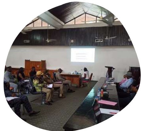
Atelier de restitution du diagnostic

Le bureau d'études AF Consulting and Engineering a été mandaté pour réaliser une étude de faisabilité en vue de la structuration et la mise en œuvre d'un service d'assainissement liquide à Limbé, en passant en revue les aspects socio-économique, organisationnels et financiers de la filière ( fonds MEAE ). Les élus, services et usagers de Limbé sont associés au déroulé de l' étude démarrée en mai 2025 . Les conclusions des diagnostics technique, social et institutionnel de la filière ont été partagées avec les acteurs locaux en septembre 2025. Il est attendu maintenant que soient proposés des scénarii de structuration de la filière, en mettant la commune au centre, et des propositions techniques chiffrées pour l'aménagement d'une station de traitement des boues de vidange issues des toilettes. Celle-ci fera l'objet d'une demande de financement auprès du guichet Ficol de l'AFD en 2026 .