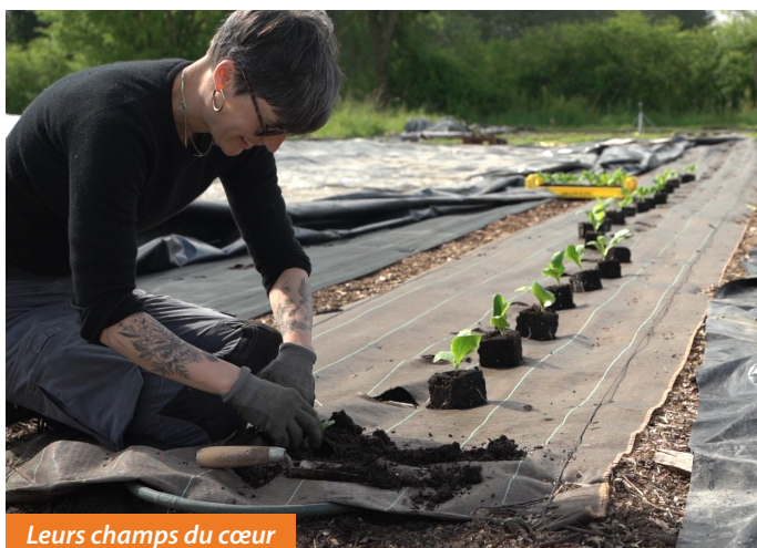
Leurs champs du cœur

2 839 projections-débats ont été organisées dans 15 pays à partir d'une sélection de 9 films abordant les enjeux multiples, à l'échelle locale et globale, de l'agriculture et l'alimentation saine et durable ainsi que les questions d'interdépendance entre la France et les pays d'Afrique notamment.