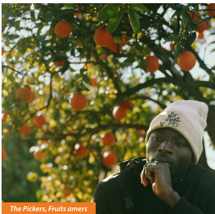
The Pickers, Fruits amers

Pour rappel, le Festival ALIMENTERRE vise à sensibiliser les citoyens sur le droit à l'alimentation et sur les nombreux impacts de notre alimentation, notamment en mettant en avant des initiatives locales individuelles et collectives pour promouvoir l'accès à une souveraineté alimentaire pour chaque pays, vertueuse pour l'environnement et la santé des individus.